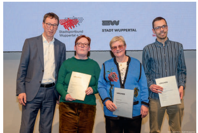
Sportler:innen des Jahres 2025 in Wuppertal kommen vom Wuppertaler Tennis Club Dönberg.