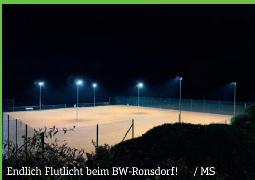
Endlich Flutlicht beim BW-Ronsdorf!