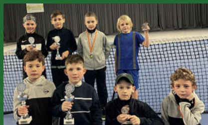
Alle Sieger und Platzierte der karottenfarbigen U9- und U10-Junioren.

A m 15. Februar wurde im Bocholter Kalisch-Sportzentrum das U9- und U10-Qualifikationsturnier um den Orange und Green Cup ausgetragen. Wer hier erfolgreich war, durfte sich Ende April im Essener TVN-Leistungszentrum für die Wettkämpfe auf Verbandsebene bewerben.