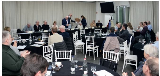
Stühle rücken im traditionellen Klingerhuf-Versammlungsraum des VIVA Event- und Freizeitparks in Neukirchen-Vluyn.

Eine Frage nach der Möglichkeit von 4er-Mannschaften auch für jüngere Altersklassen wurde angeregt, konnte aber nicht abschließend geklärt werden.