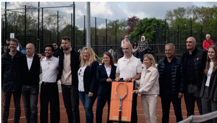
Tennis und Padel Club Monheim: offizielle Übernahme der neuen Anlage.

Das sportliche Highlight ließ nicht lange auf sich warten. Beim Showmatch traf der ehemalige Wimbledon-Profi Dustin Brown, bekannt für seinen Sieg gegen