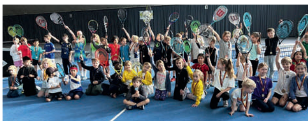
Buntes Balltreiben beim begeisterten Tennis-Nachwuchs beim 3. U9-Kleinfeldturnier in Bocholt.